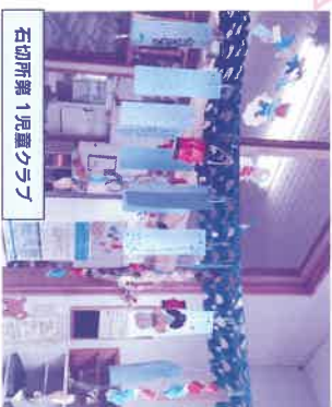
石切所第1児童クラブ