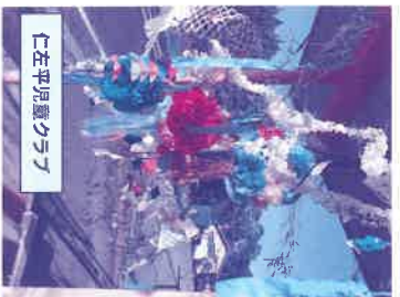
仁左平児童クラブ