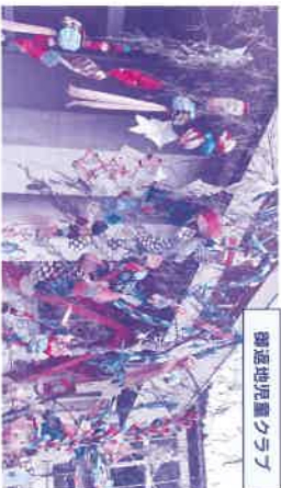
御遠地児童クラブ