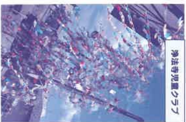
浄法寺児童クラブ