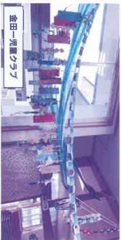
金田一児童クラブ