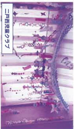
二戸西児童クラブ