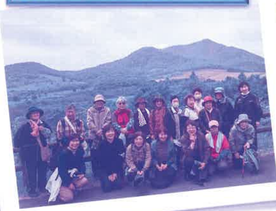
ちょこっとよさっ亭 七時雨山 ワラビ採り