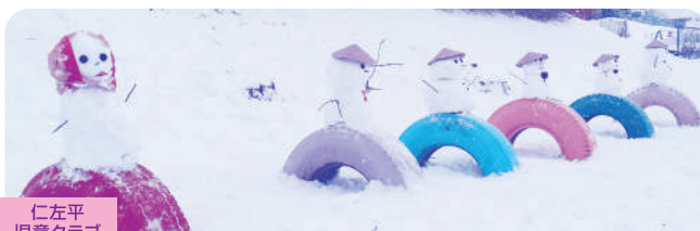
仁左平 児童クラブ

コンテストの結果と表彰式の様子は二戸市社会福祉協議会のブログに掲載します。是非ご覧ください。