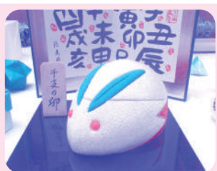
今年の干支 卯の木目込み人形の置物