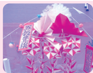
紅白鶴の 小正月飾り