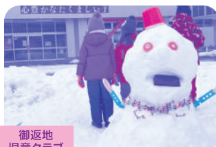
御返地 児童クラブ