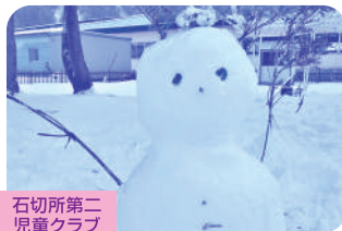
石切所第二 児童クラブ