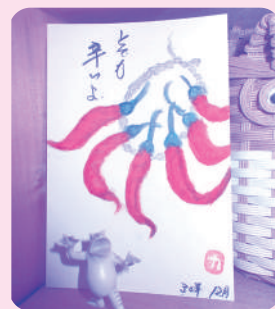
温かみのある 絵葉書