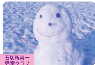
石切所第一 児童クラブ