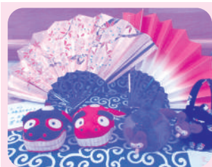
お正月の縁起物 獅子頭と文福茶釜

デイサービスを利用されている方がレク活動で作成したものや自宅で作成したものを紹介します。季節に合わせてセンターを華やかにしています。来所された際は是非ご覧ください。