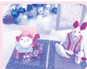
着物地で作った 卯のお人形