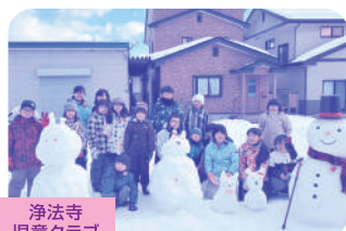
浄法寺 児童クラブ