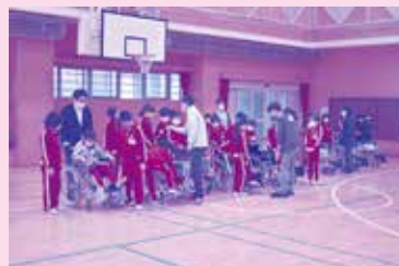
ボランティア協力校活動の支援