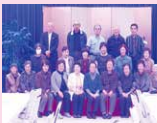
ひとり暮らし高齢者の支援