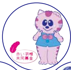
赤い羽根 共同募金