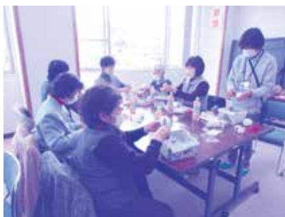
ボランティア活動支援