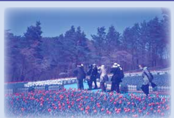
ちょこつとよさつ亭 in フォリストパーク