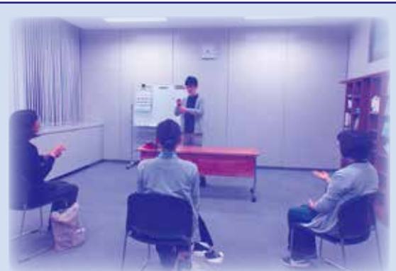
手話奉仕員養成講座