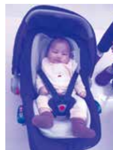
ベビーシート貸出

このほかにも二戸を住みやすくするための活動に使われています。 ご協力いただいた皆さま、ありがとうございました。