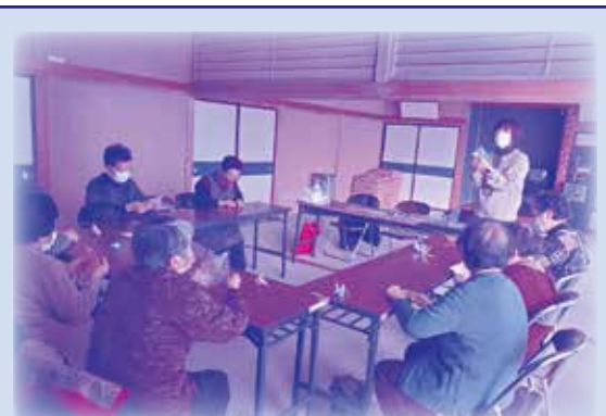
ちょこつとカフェ似鳥サテライト