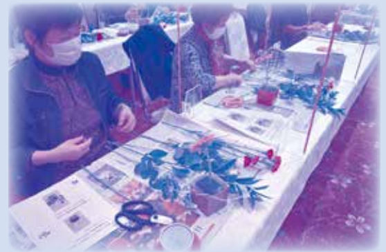
家族介護者交流会 フラワーアレンジメント体験